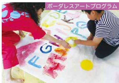
ボーダレスアートプログラム

東北応援活動から生まれた《ワンダーアートスタジオ》は、2016年のプレオープンから4年が経過しました。障がいの種別や有無、年代を超えて、個性豊かな仲間が集まり、素晴らしい創作を行っています。スタジオ開放日には、親子が自由に創作を楽しめるアトリエも開催しました。