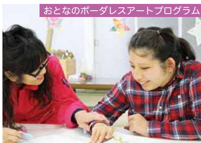
おとなのボーダレスアートプログラム