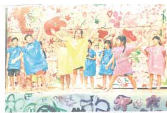
岩手日報 (2019年8月11日付)