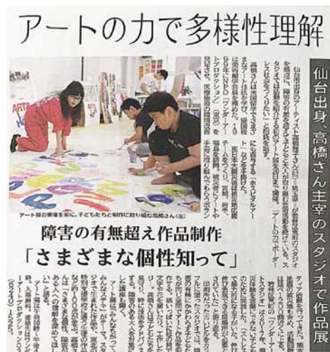
河北新報 (2019年10月10日付)