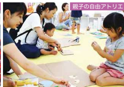
親子の自由アトリエ