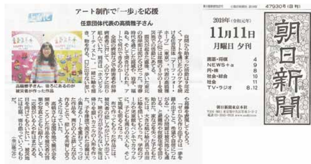
朝日新聞 (2019年11月11日付)