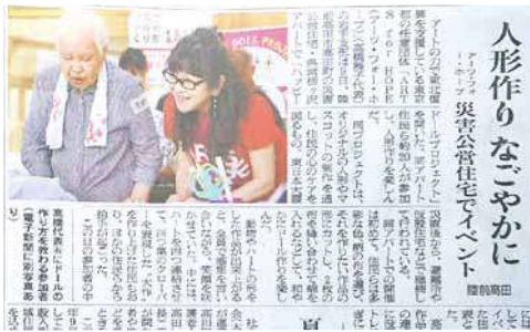
東海新報 (2019年8月11日付)