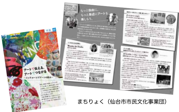
まちりよく (仙台市民文化事業団)