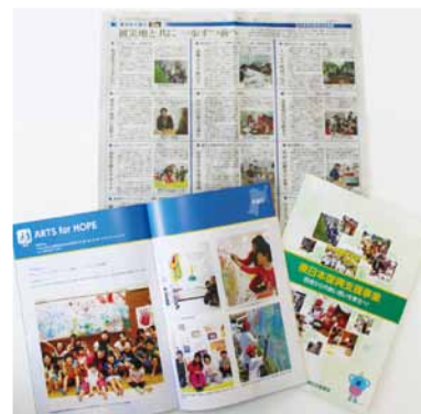
中日新聞 (2020年3月8日付)