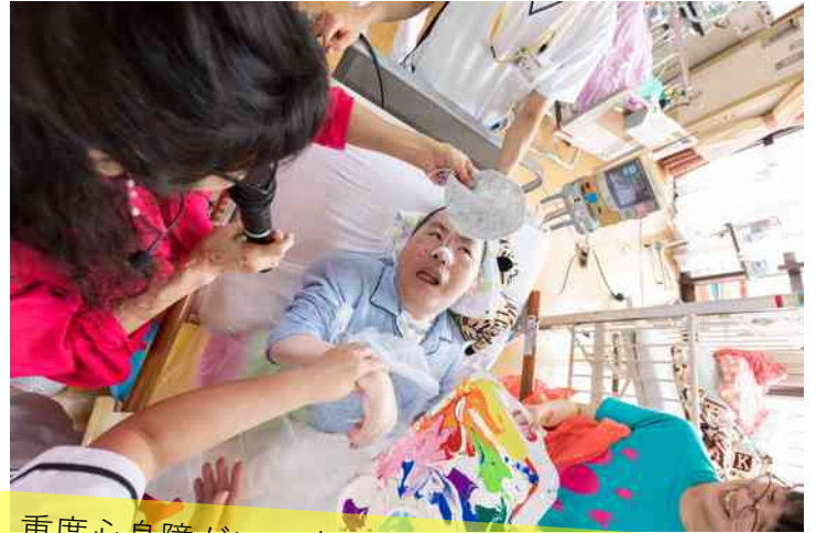
重度心身障がいの病棟。ホールで賑やかに開催した後、会場に出て来られなかった方々の病室を訪問。一人一人と制作しました。