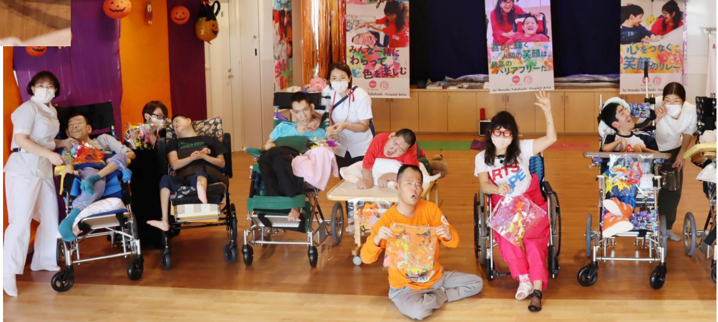
病院に隣接する手稲養護学校三角山分校の先生方もサポートに駆けつけてくれました。