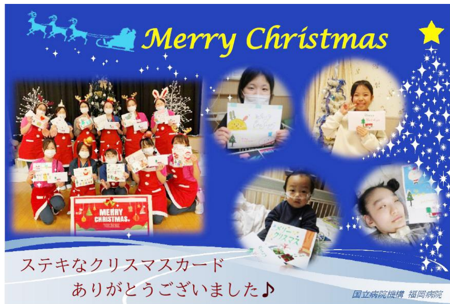
国立病院機構 福岡病院