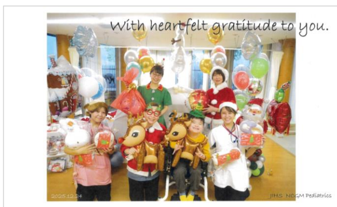
国立国際医療センター

この度はこどもたちへ心温まるクリスマスカードをお送りいただき、誠にありがとうございます。色とりどりのカードに、こどもたちは大喜び「すごーい」「かわいいね」などと笑顔で話しておりました。職員一同も、心のこもったカードに気持ちがほっこりし、感謝の気持ちでいっぱいです。（山形県立こども医療療育センター）