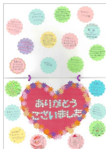
東京大学医学部附属病院