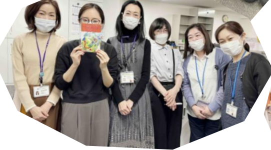
筑波大学附属病院