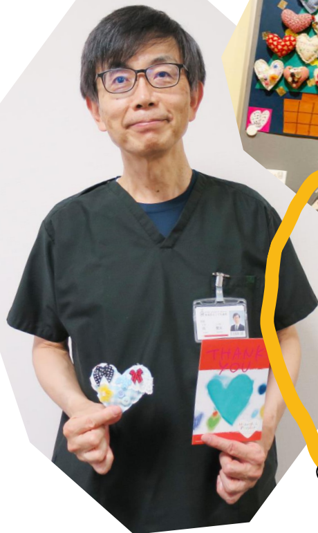
宮城県立こども病院

いつもあたたかいご支援 ありがとうございます。こ ども達が作成したハートと メッセージカードありが うございました。医療現場 の私たちへ心を込めた贈 り物、大変感謝申し上げま す。職員もボランティアさ んも立ち止まって「かわい い!!!、きれい!!!」とお話 しています。 (宮城県立こども病院)