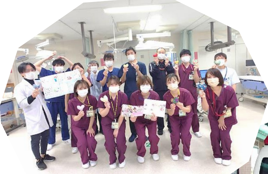
鹿児島市立病院救急救命センター

毎年たくさんのハートをありがとうございます。 終わりの見えない新型コロナウイルスへの対応 に疲弊している私たちにとって子供たちから のメッセージはとても励みになり温かい気持ち になりました。 (鹿児島市立病院救急救命センター)