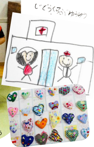
放課後児童クラブゆうゆう

びょうきにかかった人をいつてもな おしてゆれてありがとうごさいます。 おかげでまでびょうきの人かす なくなってきました。 これからもびょうきの人をなお していきたくごさい。