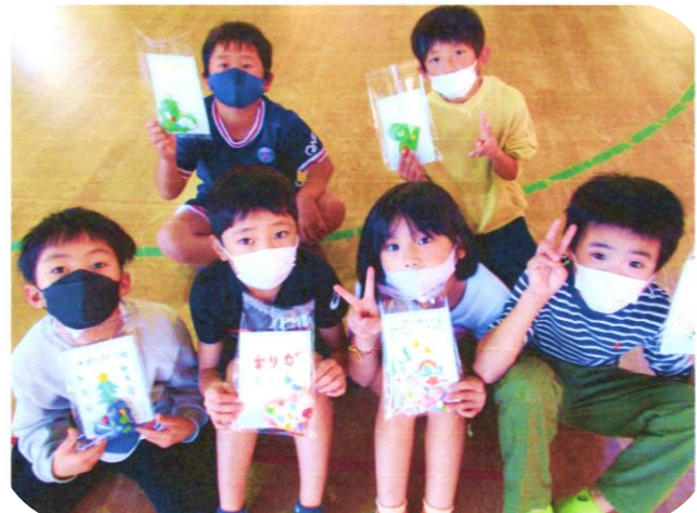
南光台東児童センター