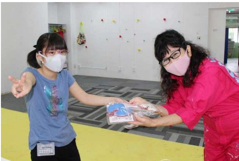
南小泉小学校（手芸クラブ） 放課後等デイサービスみらい宮城野 放課後等デイサービスウェルネスリンク（宮城県仙台市）