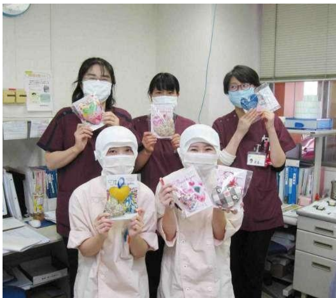
長野県立こども病院