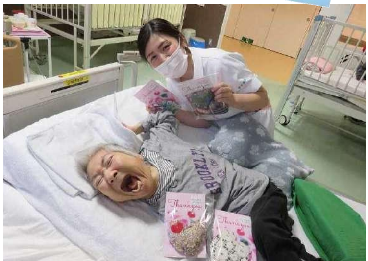
国立病院機構岩手病院