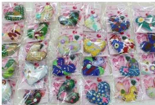
連坊小路マイスクール児童館（宮城県仙台市）