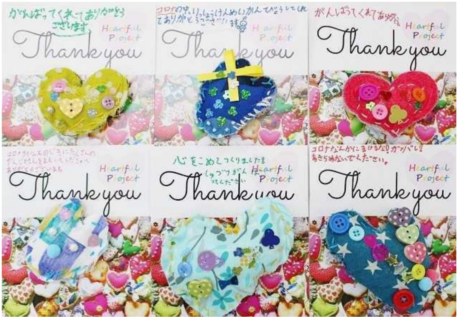
大野田児童館（宮城県仙台市）