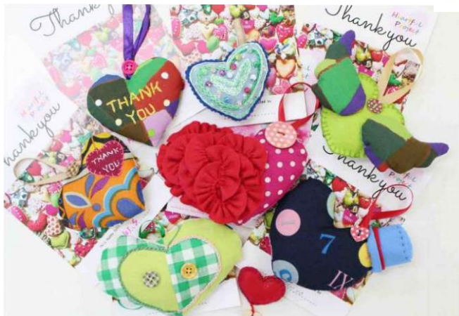
サノフィ株式会社