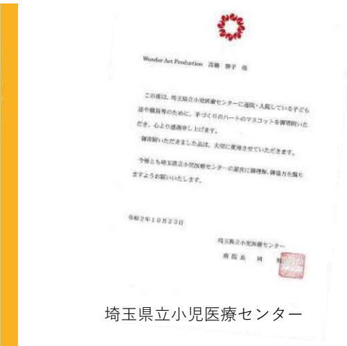
埼玉県立小児医療センター