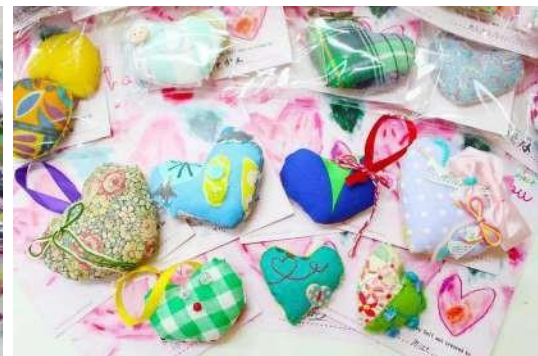
大船渡市立第一中学校（岩手県大船渡市）