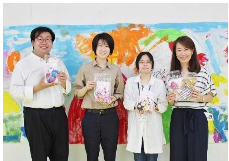
認定NPO法人Switch ユースサポートカレッジ仙台NOTE