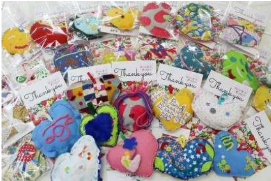
錦が丘児童館（宮城県仙台市）