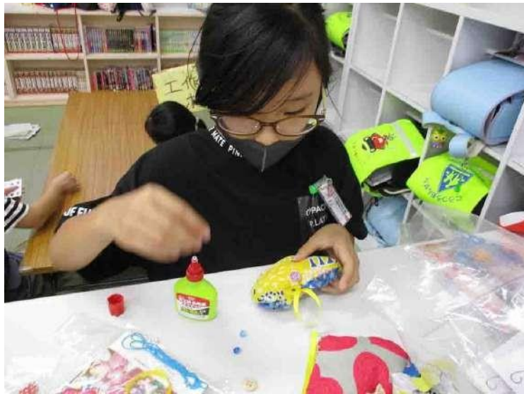
東宮城野マイスクール児童館（宮城県仙台市）