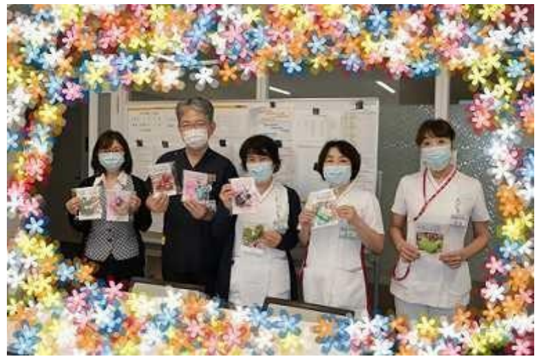
仙台オープン病院