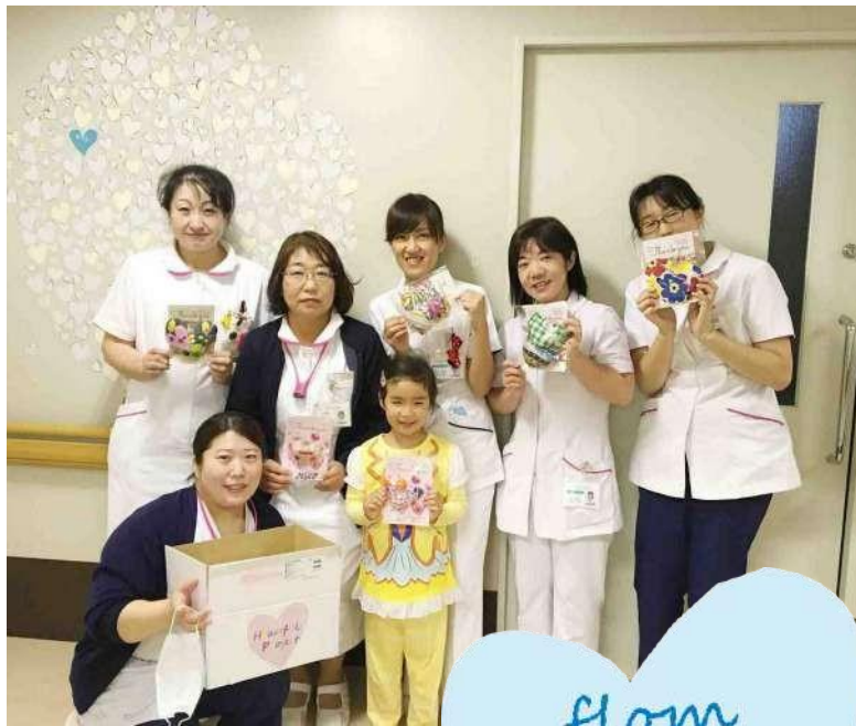
公立相馬総合病院