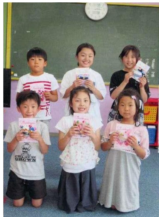
橋本町児童クラブ (福島県南相馬市)