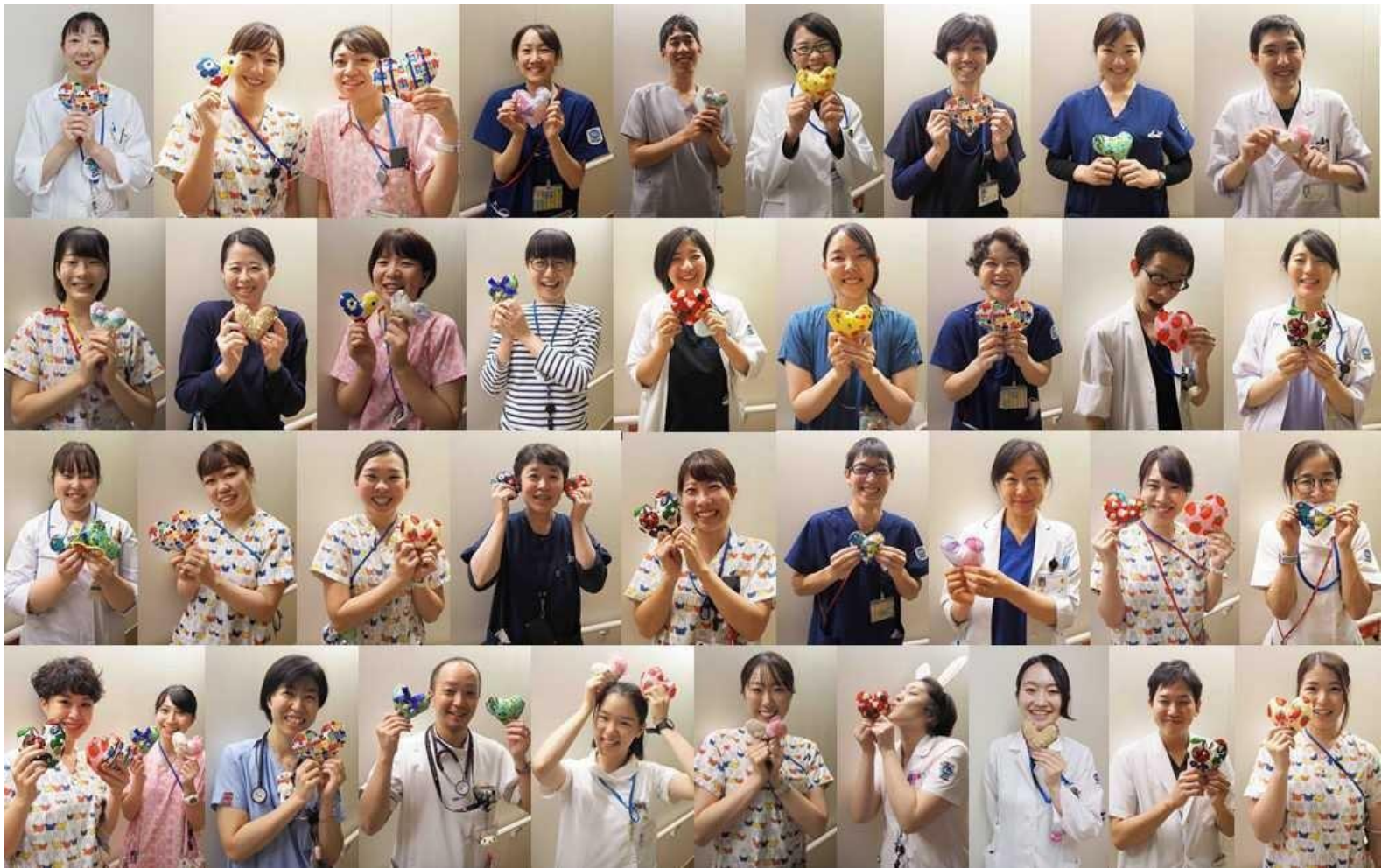
国立国際医療研究センター病院