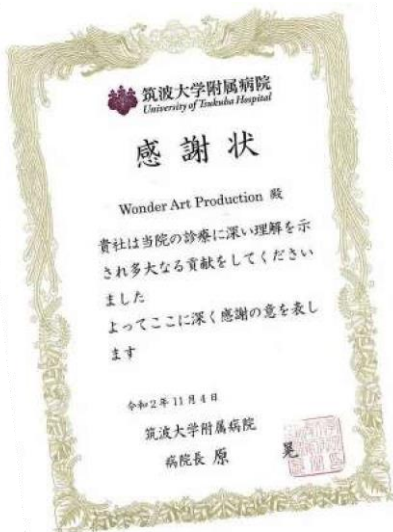
筑波大学附属病院