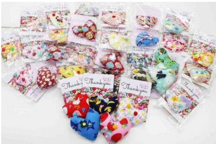
上町児童クラブ (福島県南相馬市)