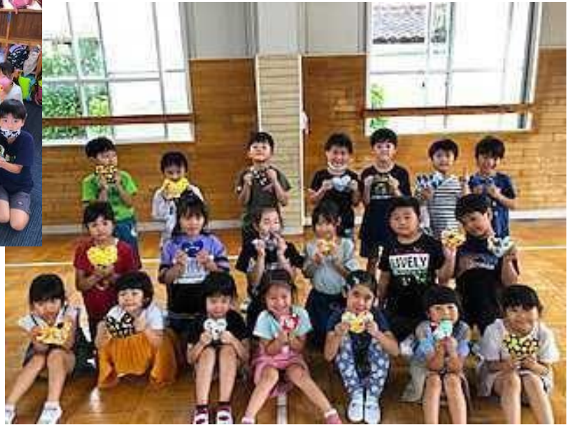
東町児童クラブ (福島県南相馬市)