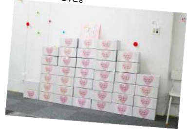
埼玉県済生会栗橋病院