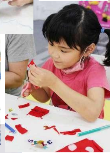
ワンダーアートスタジオ (ボーダレススタジオ 宮城県仙台市)