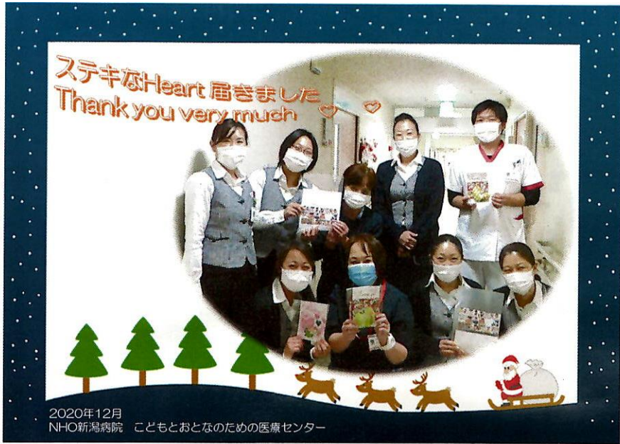
2020年12月 NHO新潟病院 こどもとおとなのための医療センター