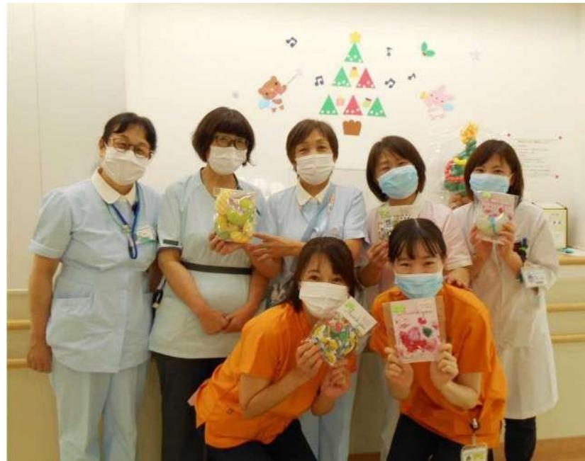
岐阜県総合医療センター