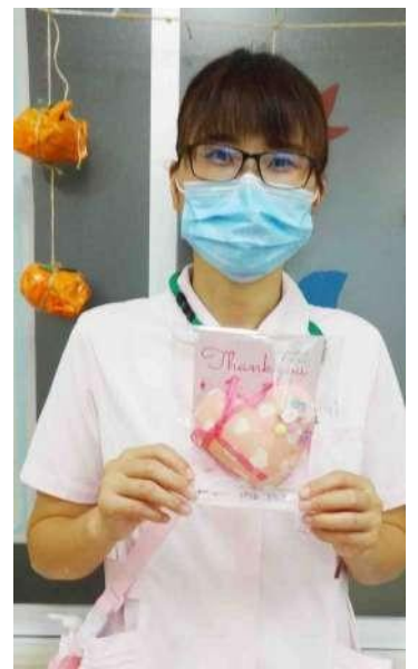
国立病院機構三重病院