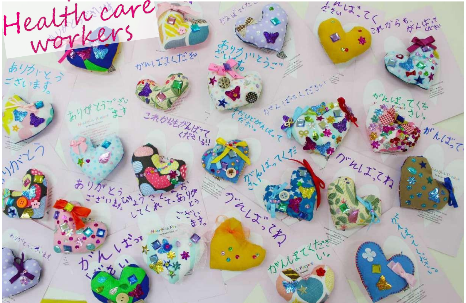
長命ヶ丘児童センター（宮城県仙台市）