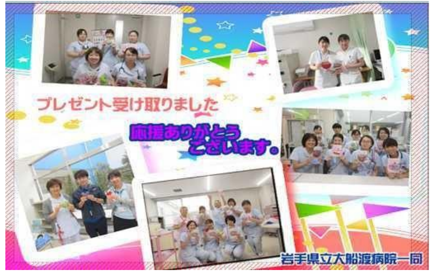
岩手県立大船渡病院