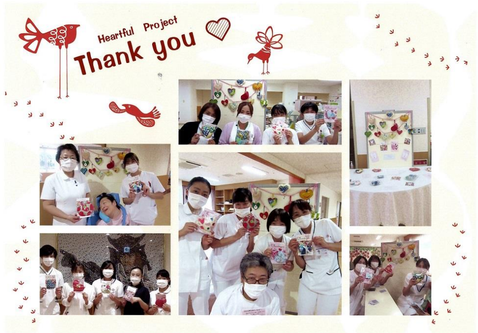
国立病院機構米沢病院