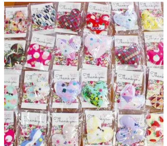
太田児童クラブ (福島県南相馬市)