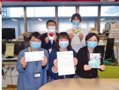
弘前大学医学部附属病院