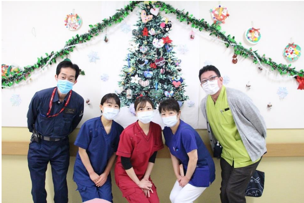
鳥取大学医学部附属病院