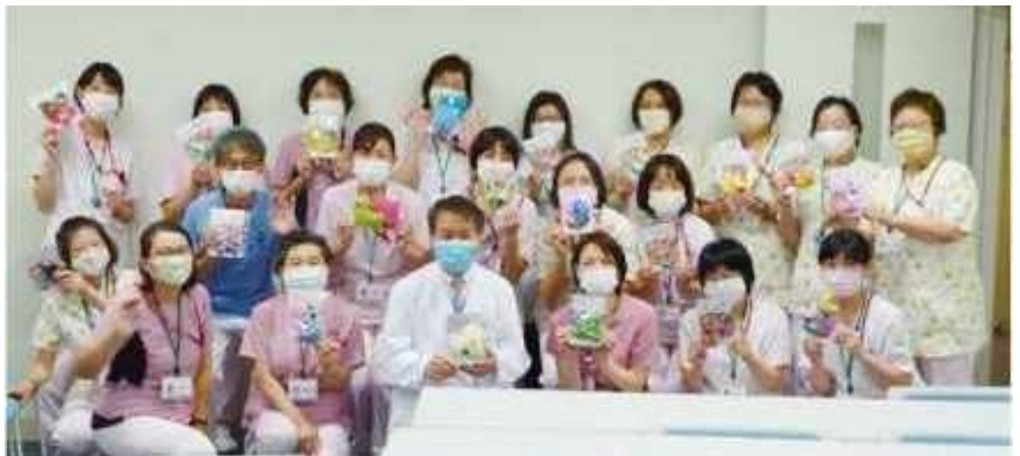
兵庫県立こども病院