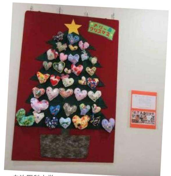
自治医科大学 とちぎ子ども医療センター