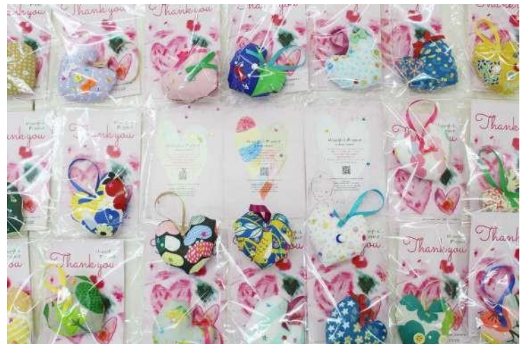
中野栄児童館（宮城県仙台市）