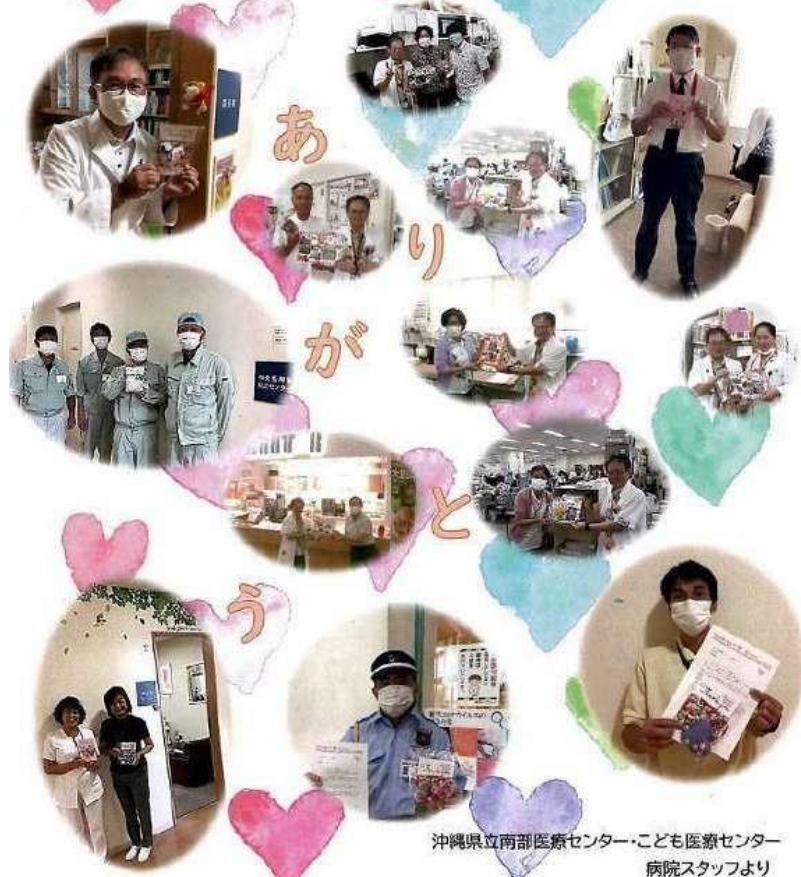
沖縄県立南部医療センター・こども医療センター 病院スタッフより

沖縄へ心のもった温かいハート届いていますよ～！ 「仙台の子どもたちの手作りです」と手渡すと、受け取った病院スタッフみんな“笑顔”で嬉しそうでした。ありがとうございました。