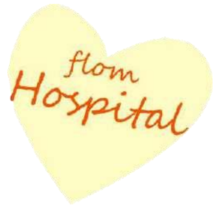
国立病院機構新潟病院