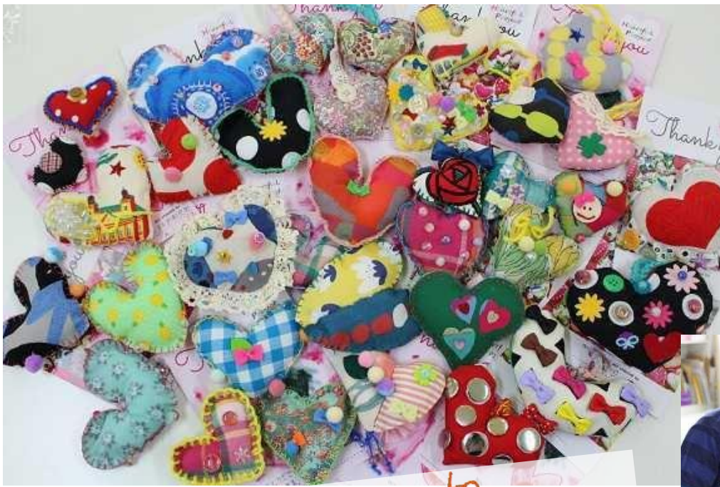
ゴールドマン・サックス